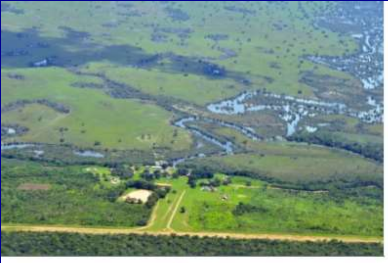
TI Xingu.