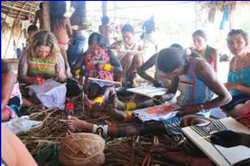
Oficina de Pintura em Tecido com mulheres Kayapó