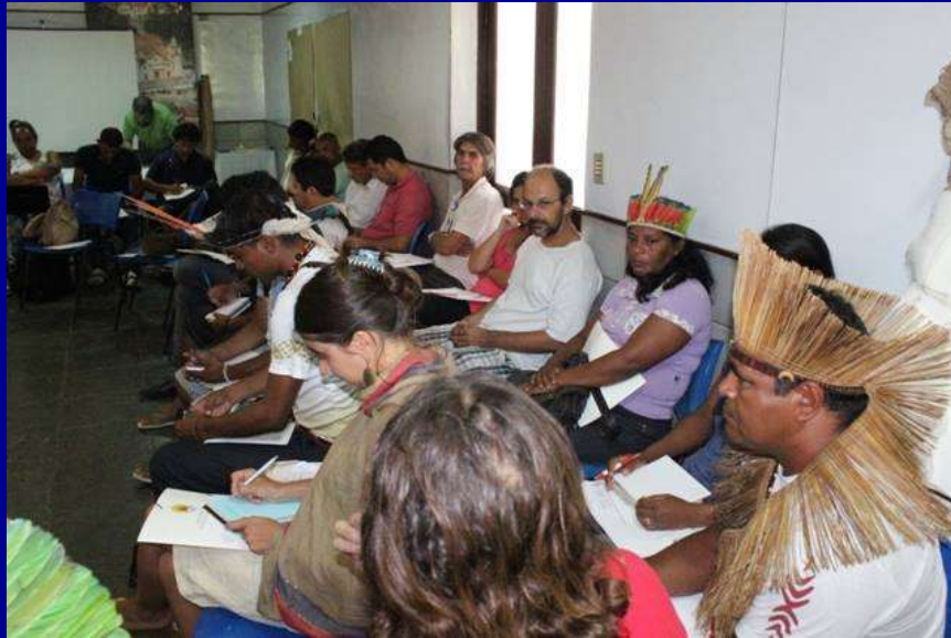
Oficina do Nordeste que definiu critérios para o curso em PNGATI.