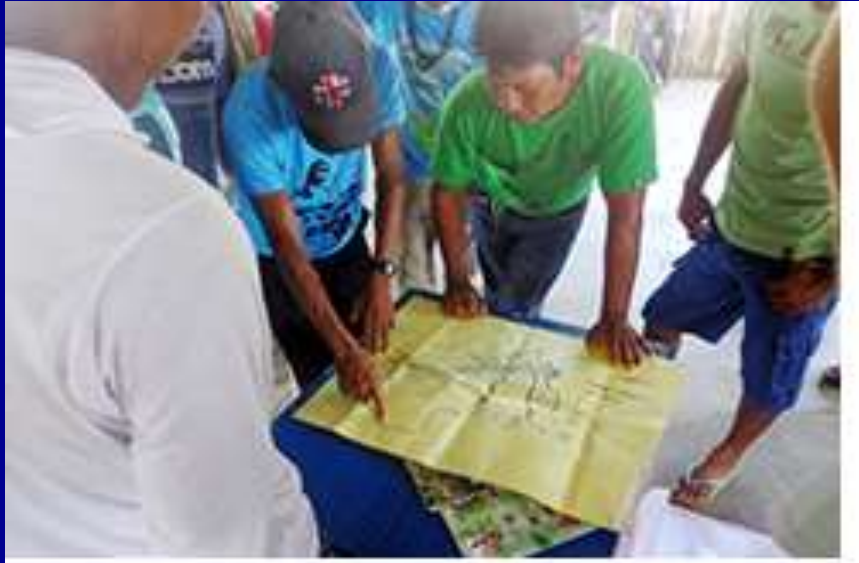
Discussão PGTA Munduruku