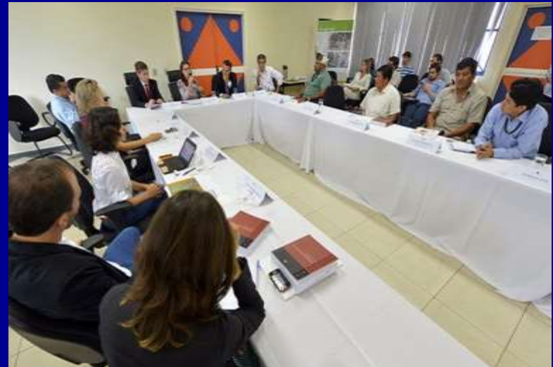
Instalação do Comitê Gestor da PNGATI