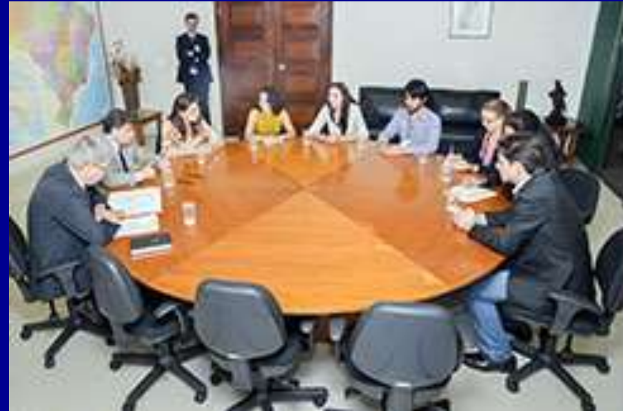
Reunião para firmar acordo de cooperação Funai e ICMBio.