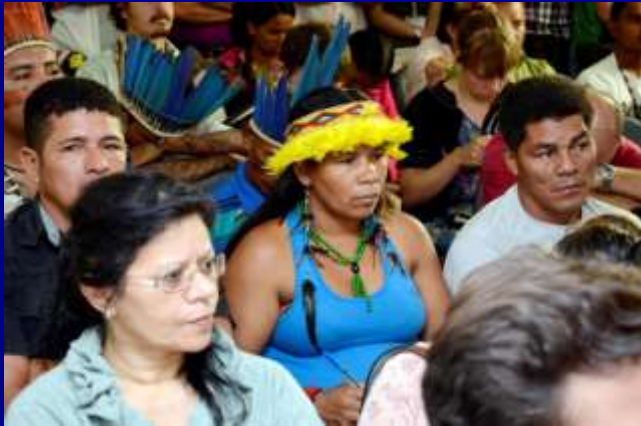
Participantes do side event da Funai na Rio + 20