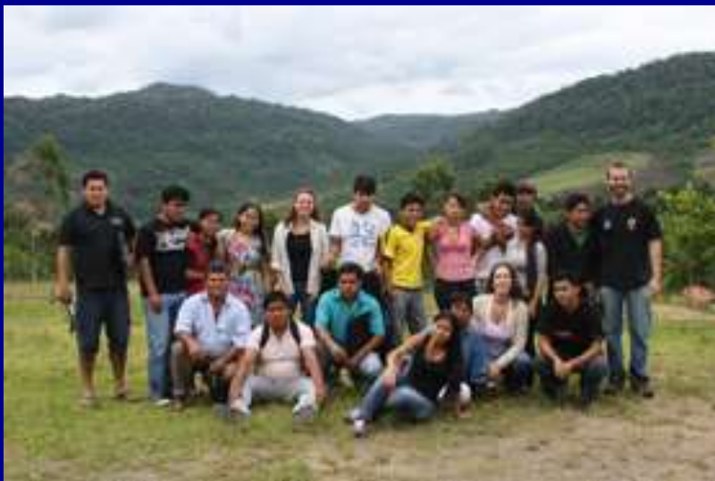
Oficina de cartografia e uso de GPS para indígenas Xokleng