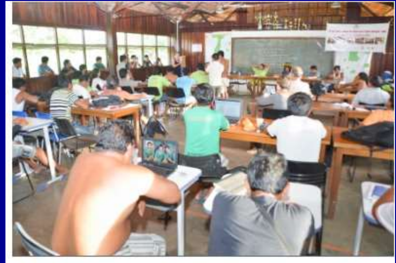
Assembléia ATIX, discutindo turismo em TI.