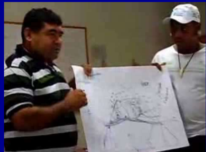
Indígenas participantes de capacitação de Comitê de Bacias do Rio Doce