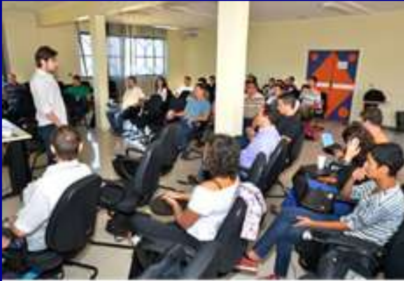
Capacitação em Proteção Territorial, para servidores da Funai -2013.