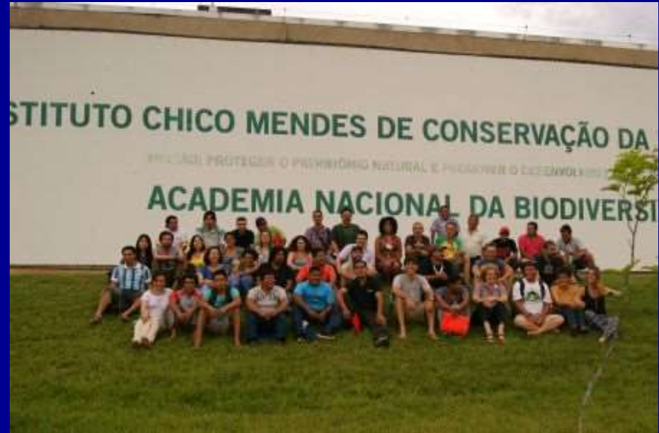
Turma do Sul e Sudeste na Acadebio durante o curso de formação em PNGATI.